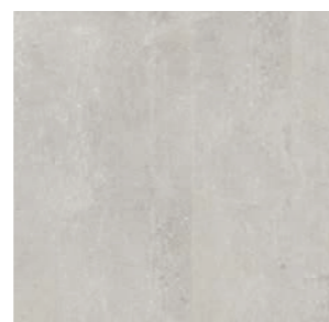
Toronto OFW 60x60 / 24x24"