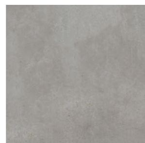
Toronto GR 60x60 / 24x24"