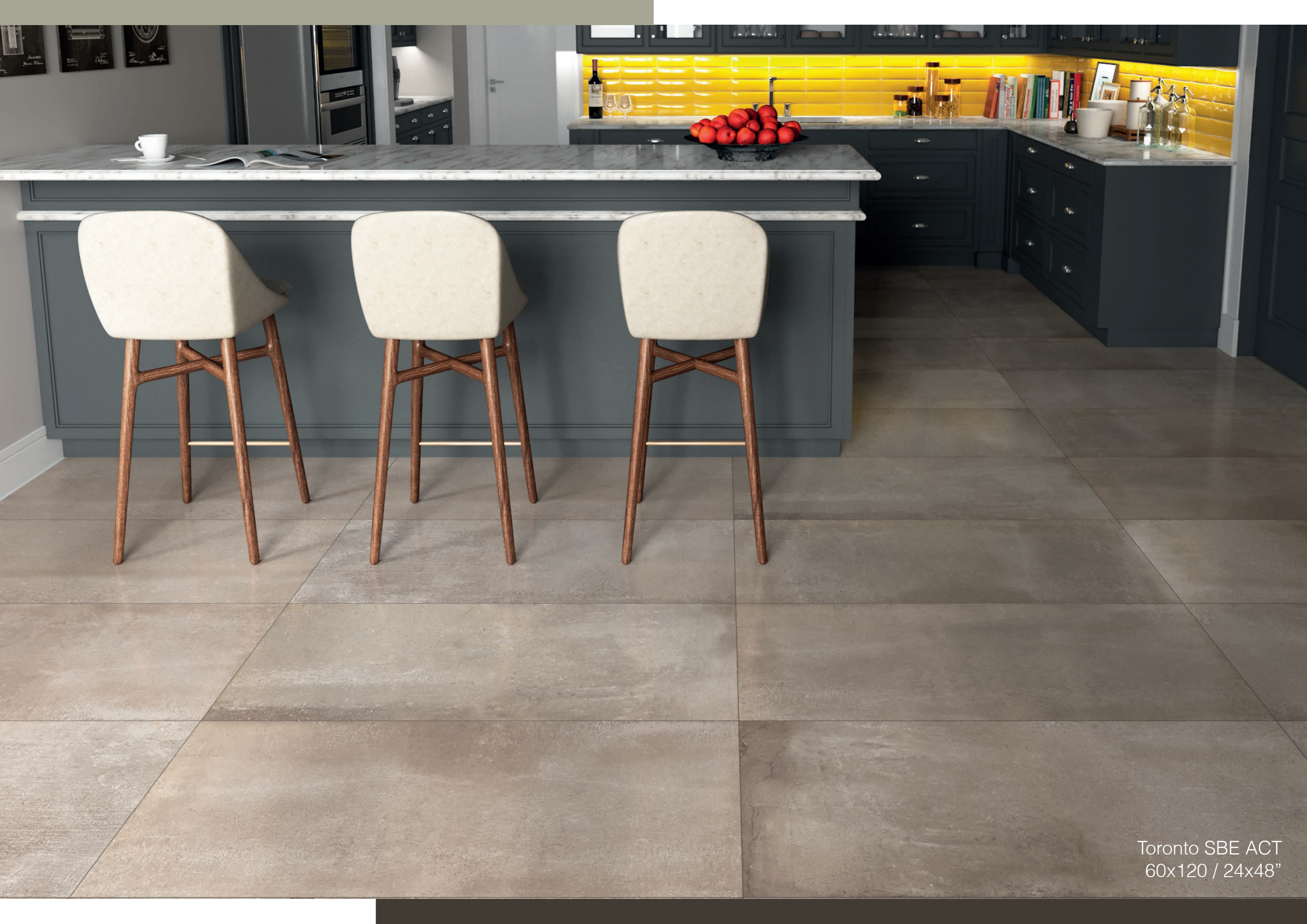
Toronto SBE ACT 60x120 / 24x48"