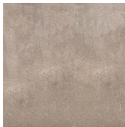
Toronto SBE 90x90 / 36x36"