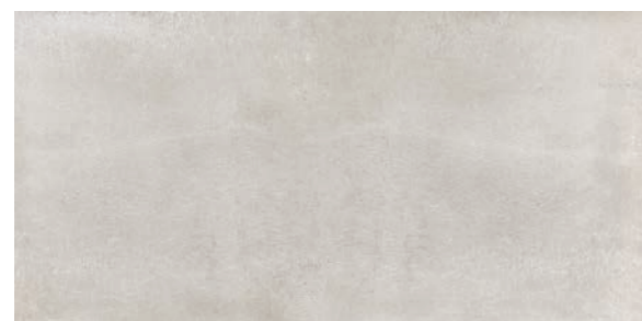
Toronto OFW 60x120 / 24x48"

Cores e formatos Colors and sizes | Colores y formatos