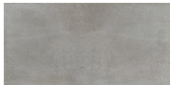
Toronto GR 60x120 / 24x48"