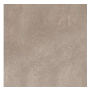
Toronto SBE 60x60 / 24x24"