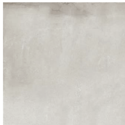
Toronto OFW 90x90 / 36x36"