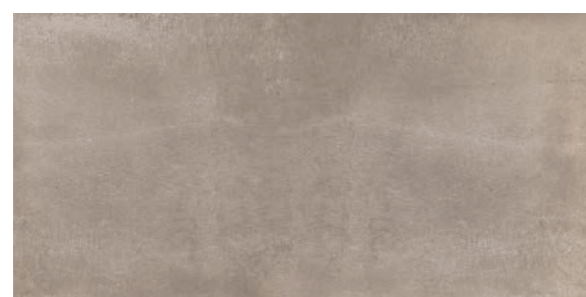
Toronto SBE 60x120 / 24x48"