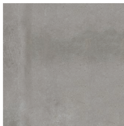
Toronto GR 90x90 / 36x36"