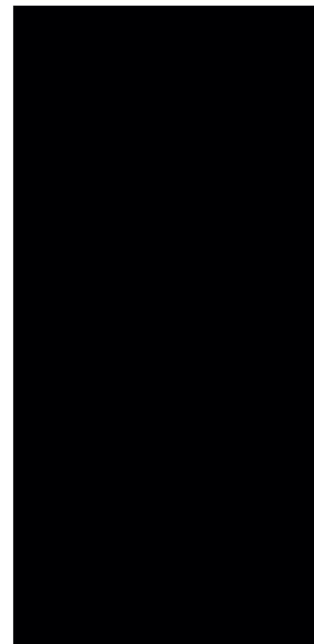
Recital BK 160x320 / 63x126" 1600,0x3200,0x12,0 mm ACT BOLD V1 - USO PP