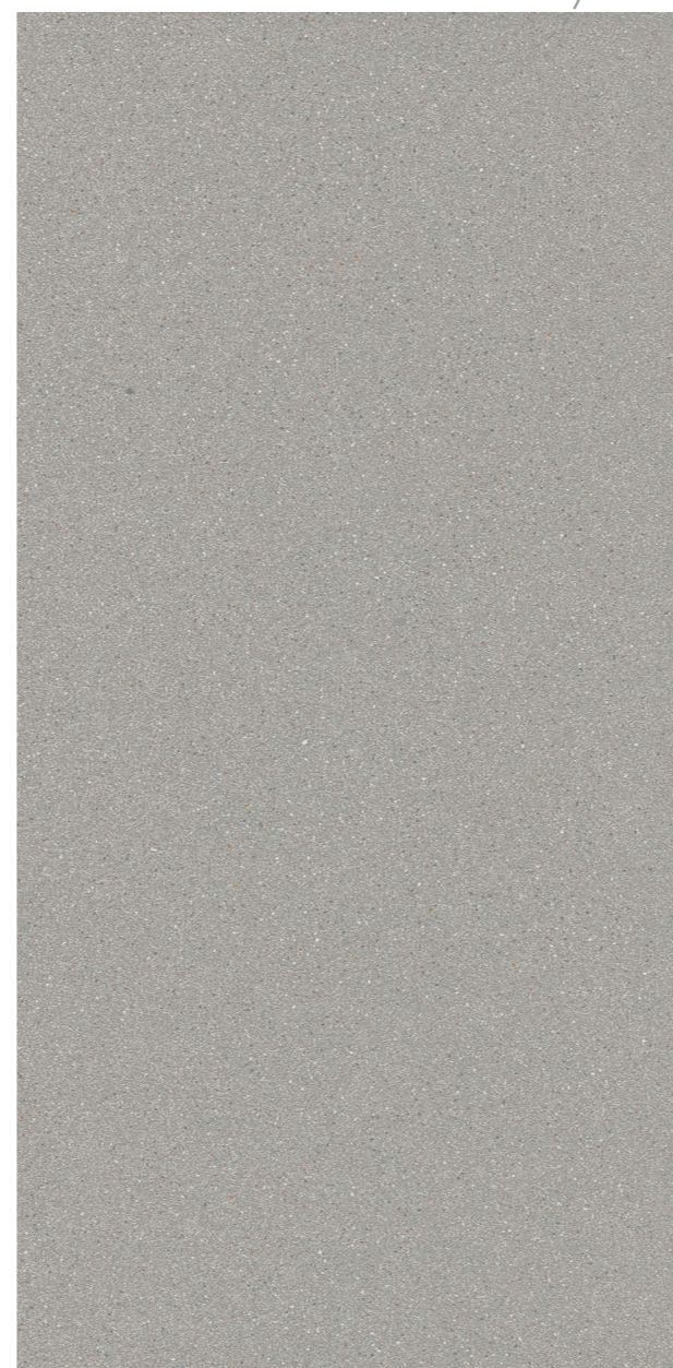
Recital SGR 160x320 / 63x126" 1600,0x3200,0x12,0 mm ACT RET V3 - USO PP