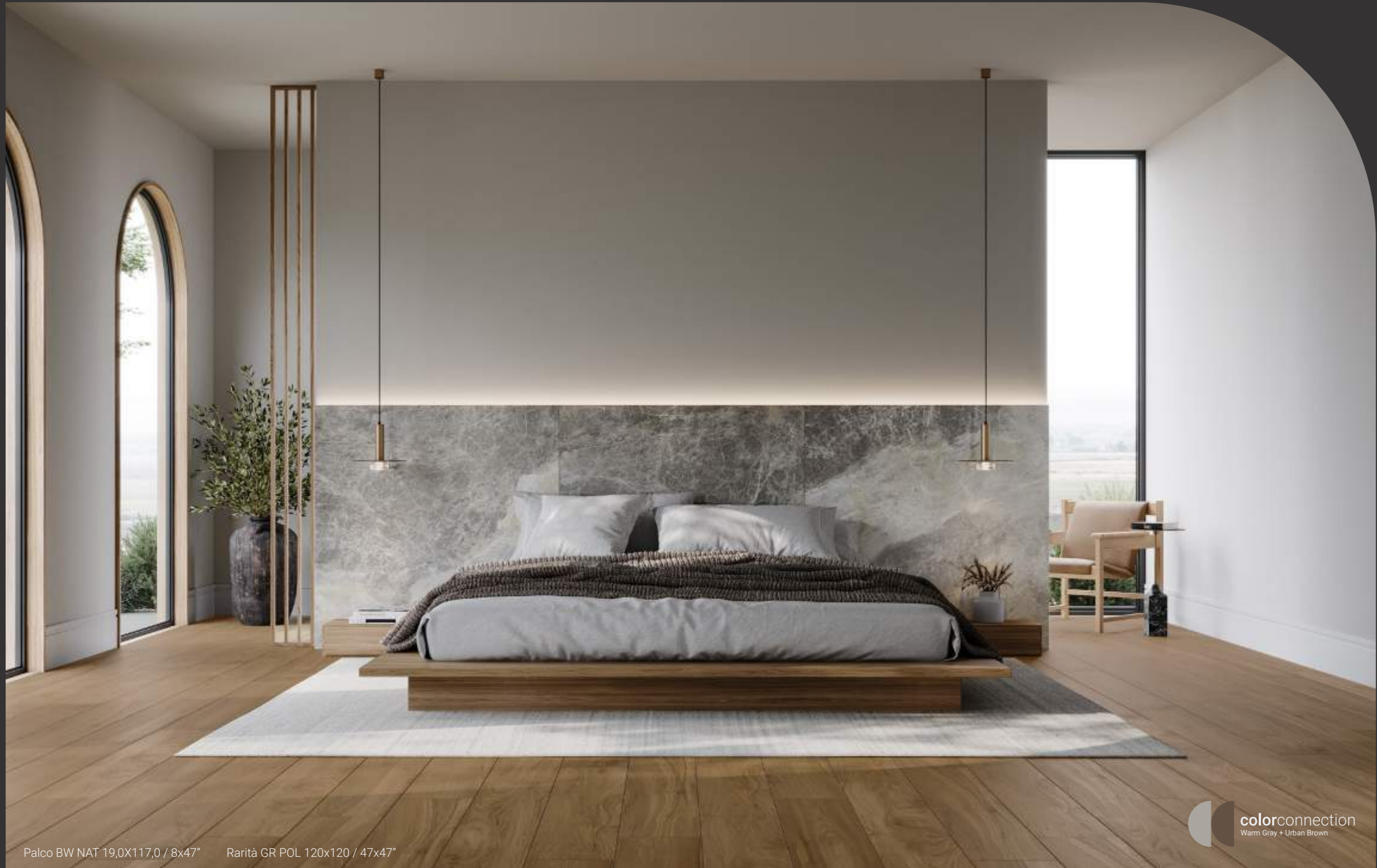
Palco BW NAT 19,0X117,0 / 8x47" Rarità GR POL 120x120 / 47x47"