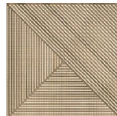
Luthier Decor BE 60x60 / 24x24" NAT RET V3 - USO 1