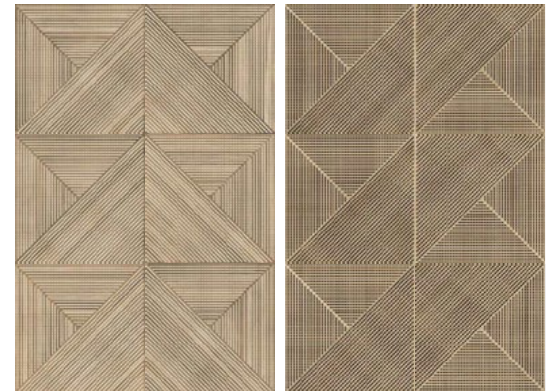
Luthier Decor BE 60x60 / 24x24"