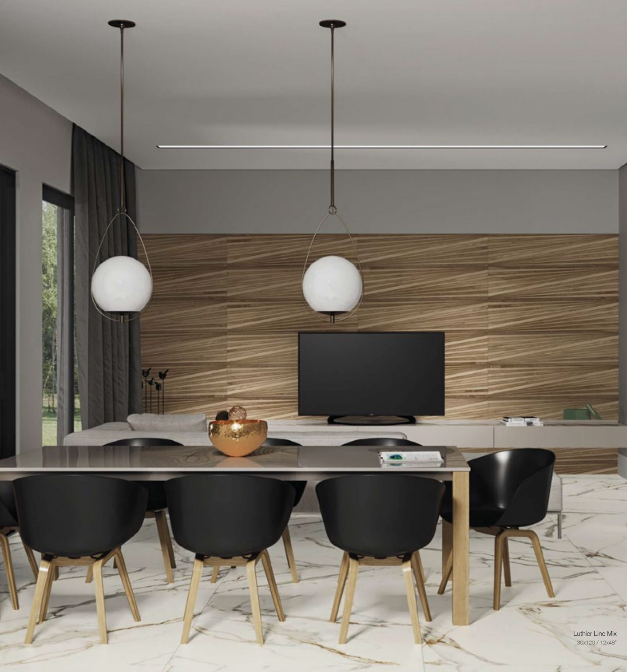
Luthier Line Mix 30x120 / 12x48"