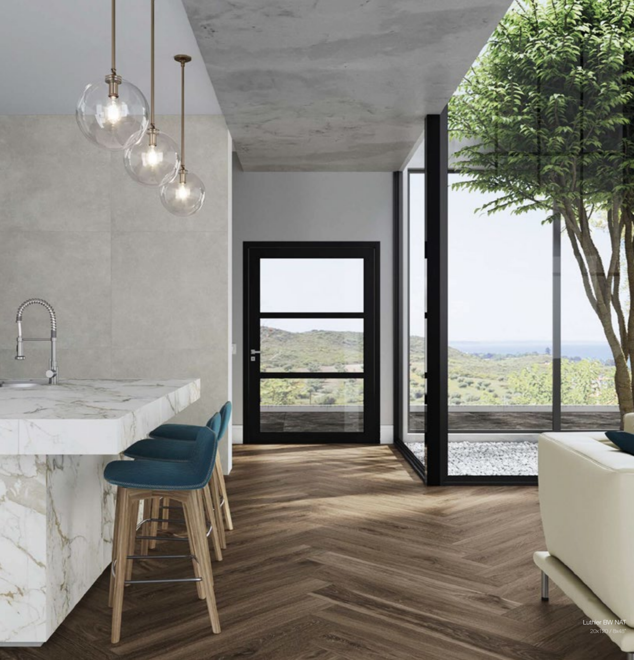
Luthier BW NAT 20x120 / 8x48"

Variação visual Shade variation / Variación de tono