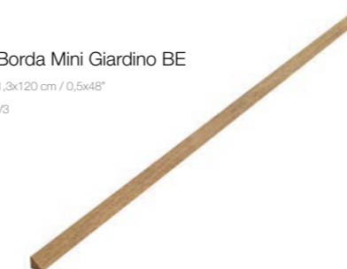
Borda Mini Giardino BE 1,3x120 cm / 0,5x48" V3