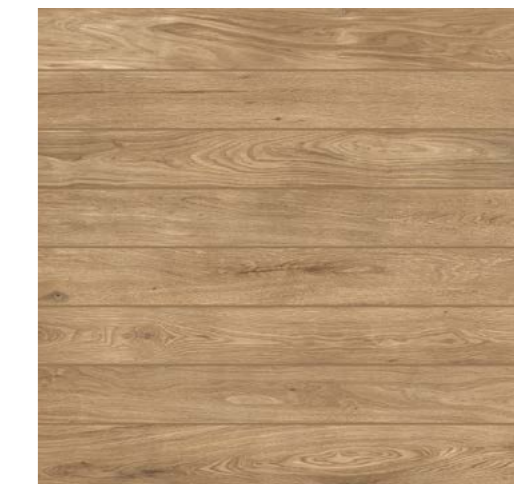
Giardino BE Deck 90x90 cm / 36x36"