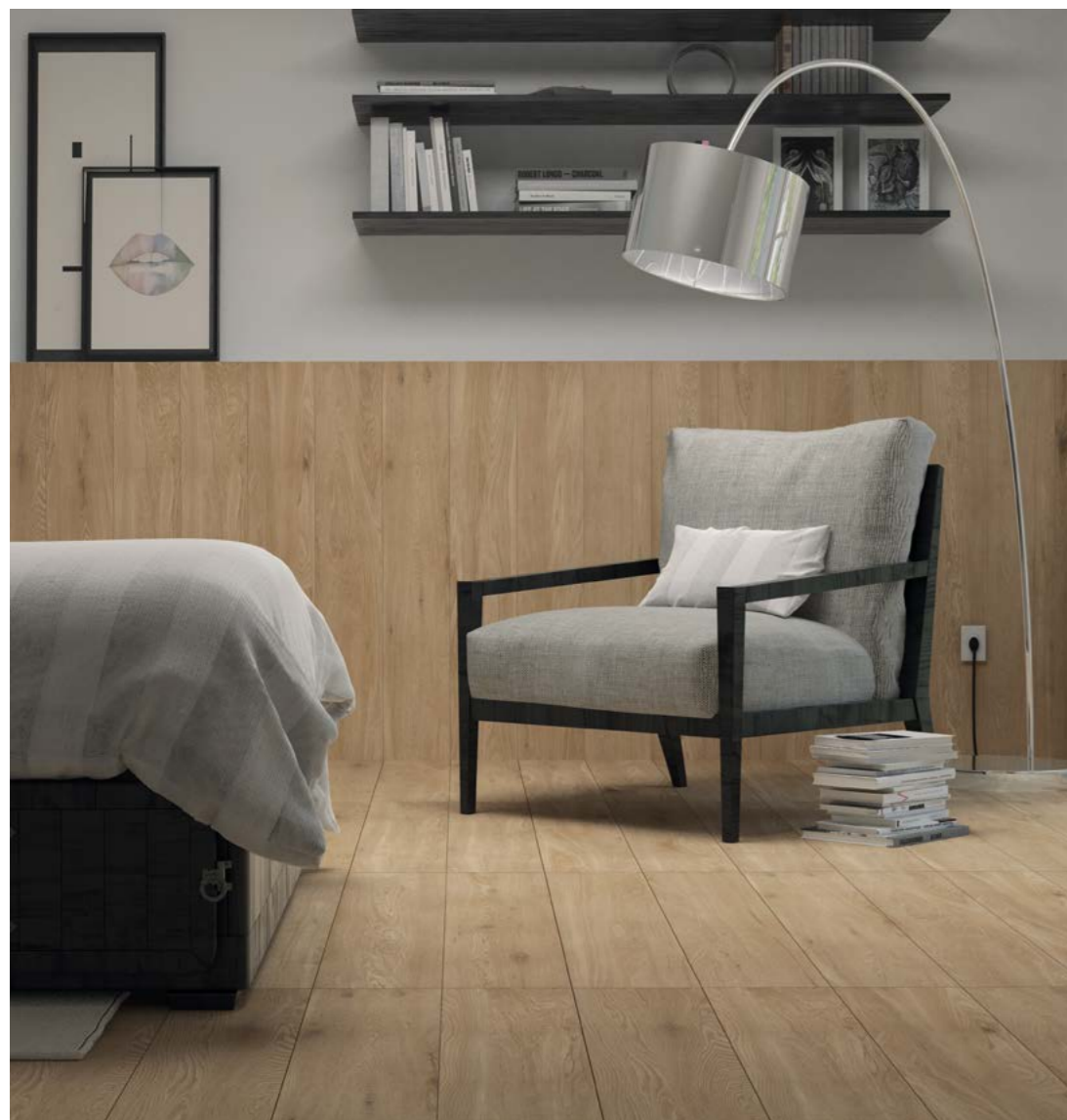
Giardino BE ACT 20x120 cm / 8x48"

La personalidad del carvalho en el confort de los ambientes.