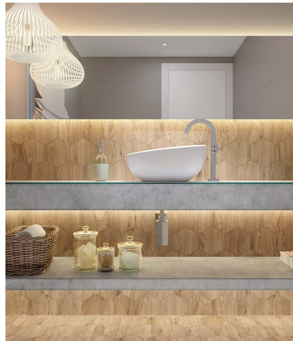
Giardino Hexa BE NAT 17,5x17,5 cm / 7x7"