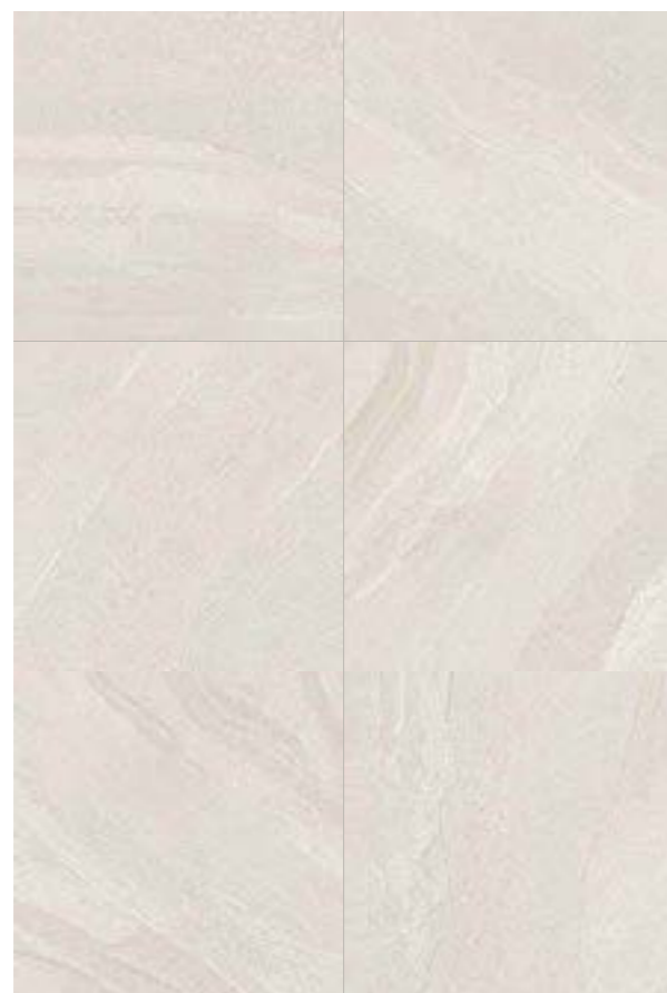
Gales SGR 120x120 / 48x48"

Variação visual Shade variation | Variación de tono