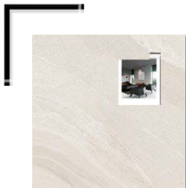
Gales SGR NAT 120x120 / 48x48"

As marcas e intempéries nos solos das grandes cidades do mundo são expressadas em porcelanato. Essa pulsação urbana serviu de inspiração para a coleção Città, que carrega em sua superfície os traços das grandes metrópoles e características do cimento queimado. Com design marcado com leves nuances, composta por uma paleta de cinco cores que permeia dos tons frios aos quentes, a coleção remonta a sobriedade dessa atmosfera urbana que abriga grande parte da população.