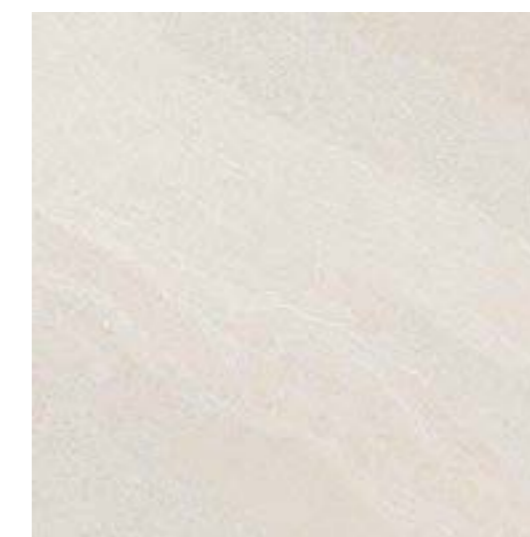
Gales SGR 120x120 / 48x48" NAT / HARD RET V3 - USO 5