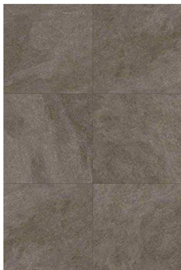
Gales BK 120x120 / 48x48"