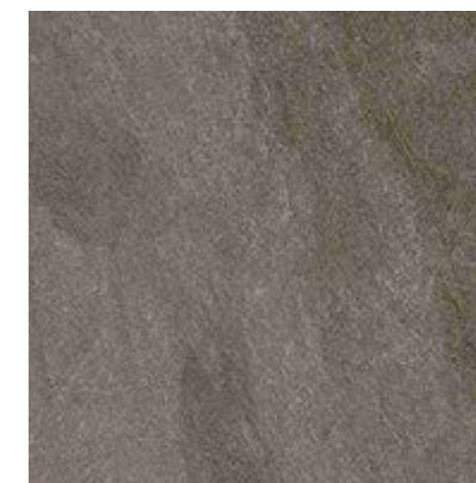
Gales BK 120x120 / 48x48" NAT / HARD RET V3 - USO 5