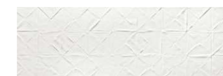
Origami WH 30x90 / 12x36" MLX RET V2 - USO 1