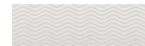
Ondas 30x90 / 12x36" MATTE RET V1 - USO 1

La creatividad entra en escena para atreverse en un juego de luces y sombras combinadas con las piezas de porcelanato capaces de emanar sensibilidad en alto relieve.