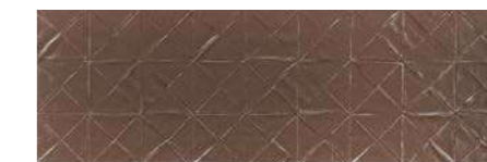
Origami Steel GD 30x90 / 12x36" MLX RET V2 - USO 1