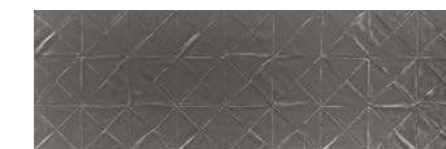
Origami Steel GR 30x90 / 12x36" MLX RET V2 - USO 1