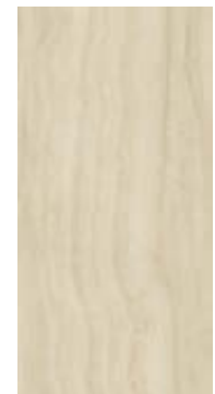
Coliseu BE 60x120 / 24x48" NAT / POL / HARD RET V3 - USO 5