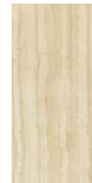
Coliseu OFW 60x120 / 24x48" NAT / POL / HARD RET V3 - USO 5