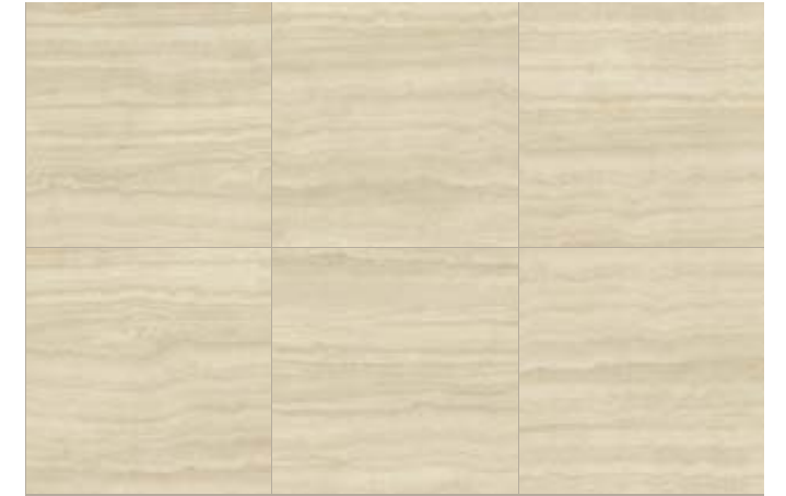
Variação visual | Shade Variation | Variación de tono Coliseu BE 100x100 / 40x40"