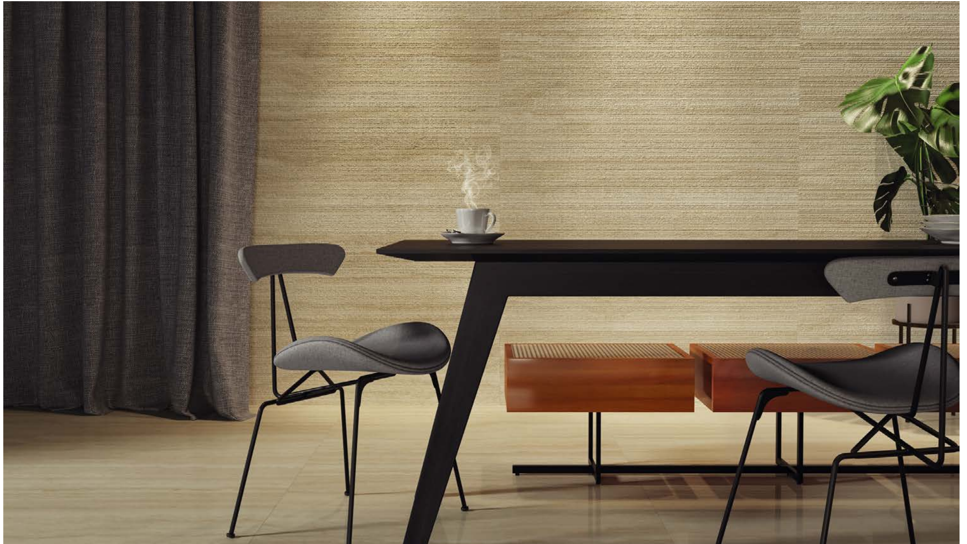
Coliseu BE NAT 100x100 / 40x40" Coliseu Decor BE NAT 30x120 / 12x48"