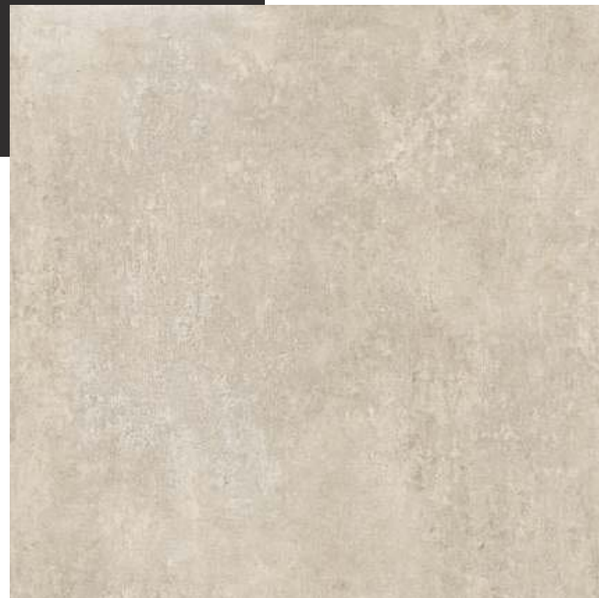
Chicago HD SGR | 90x90 cm | 36x36"