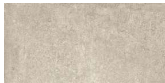
GDN Chicago HD SGR | 30x60 cm | 12x24"