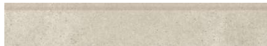
Chicago HD SGR | 15x90 cm | 6x36"