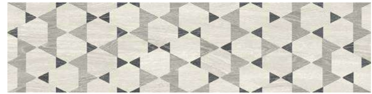
Chaplin Decor Mix 30x120 / 12x48" NAT RET V3 - USO 1