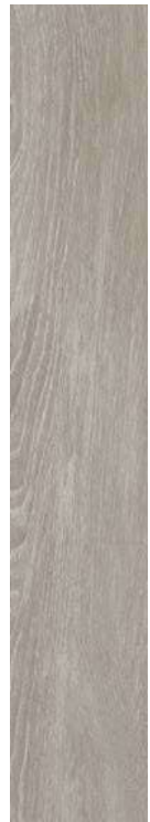
Chaplin GR 20x120 / 8x48" NAT RET V3 - USO 5