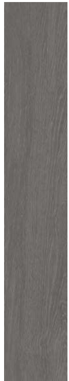
Chaplin DGR 20x120 / 8x48" NAT RET V3 - USO 5