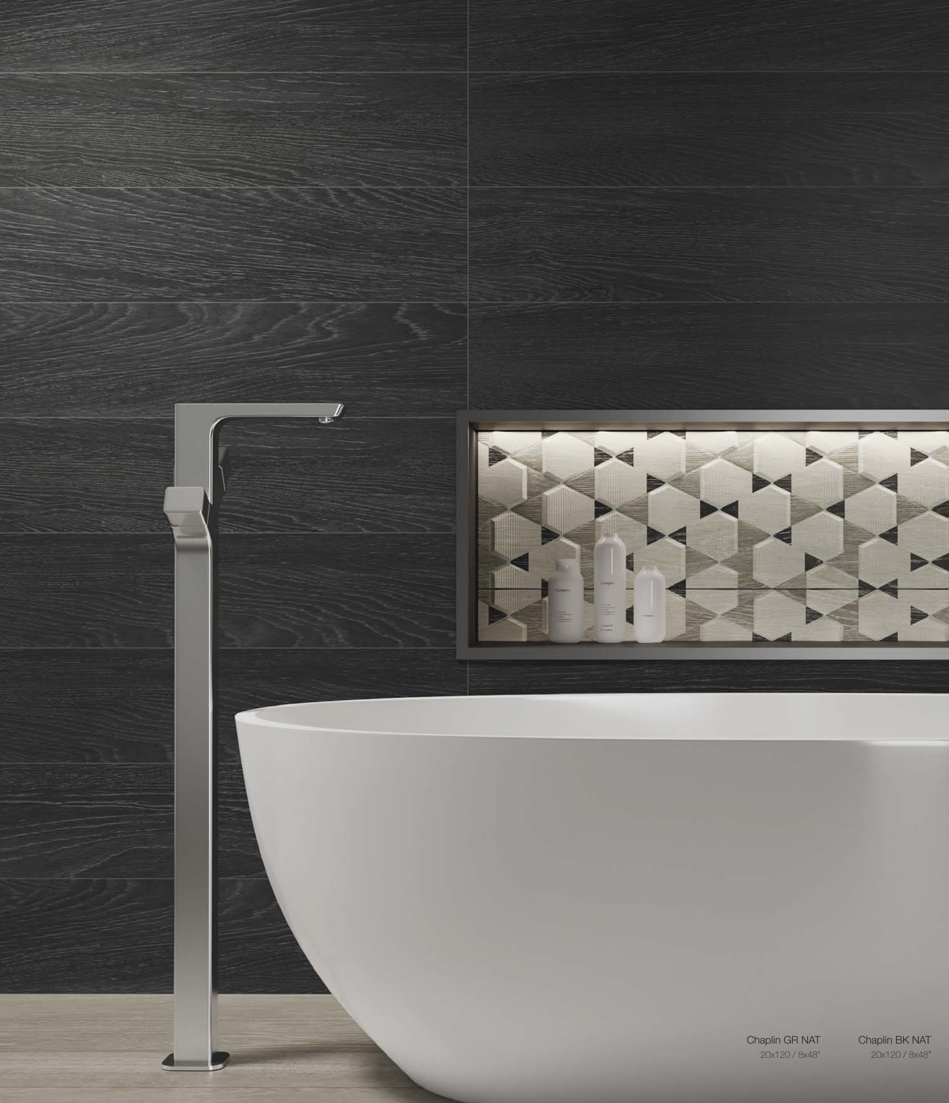
Chaplin GR NAT 20x120 / 8x48"