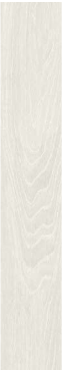
Chaplin WH 20x120 / 8x48" NAT RET V3 - USO 5