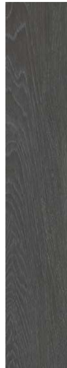
Chaplin BK 20x120 / 8x48" NAT RET V3 - USO 5