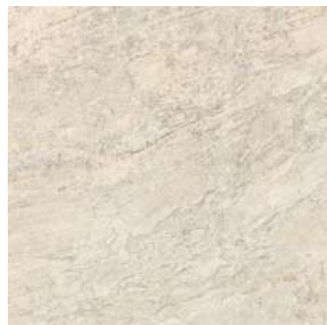
Cabernet HD WH USO 6