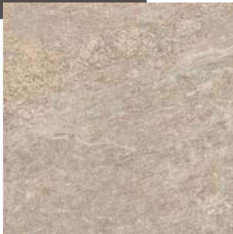
Cabernet HD GR USO 5