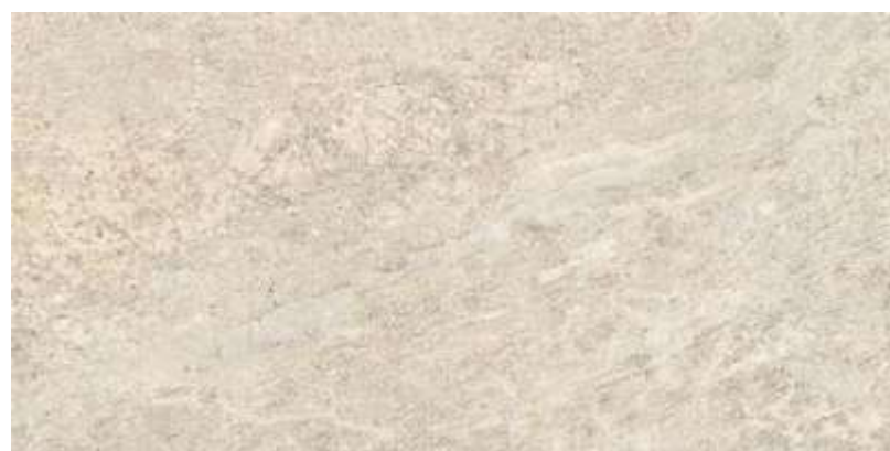
Cabernet HD WH | 60x120 cm | 24x47"