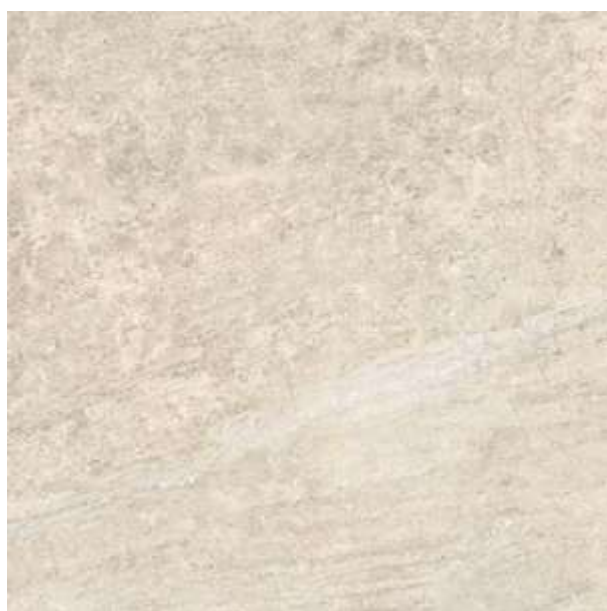
Cabernet HD WH | 90x90 cm | 36x36"