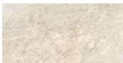
GDN Cabernet HD WH | 30x60 cm | 12x24"