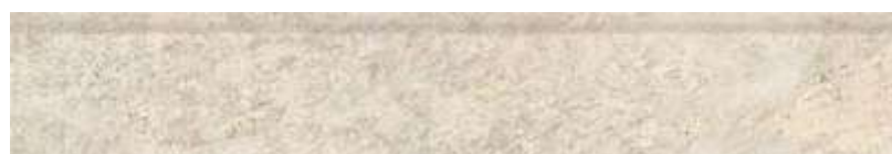
RP Cabernet HD WH | 20x120 cm | 8x47"