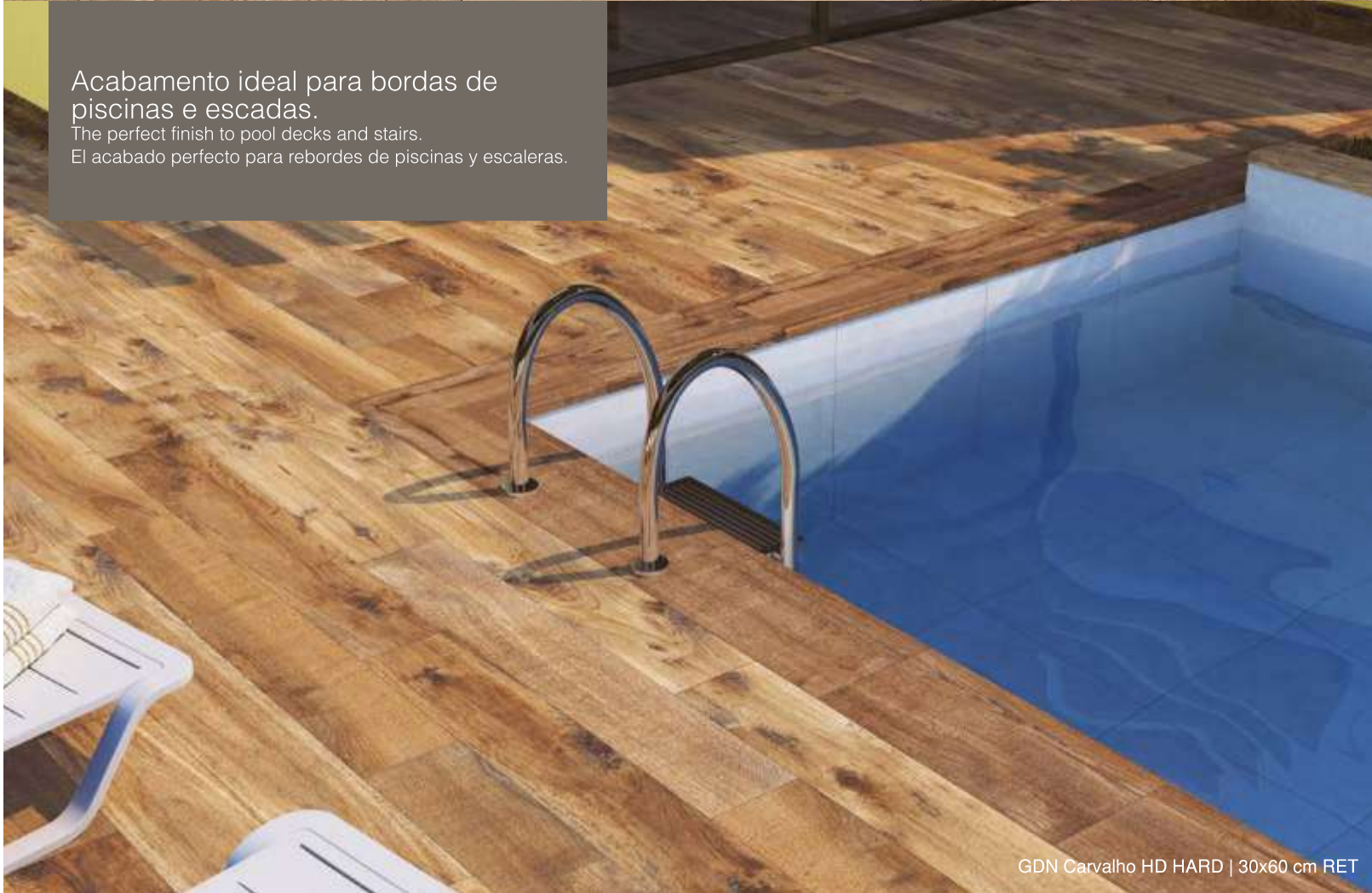
GDN Carvalho HD HARD | 30x60 cm RET

Acabamento ideal para bordas de piscinas e escadas. The perfect finish to pool decks and stairs. El acabado perfecto para rebordes de piscinas y escaleras.