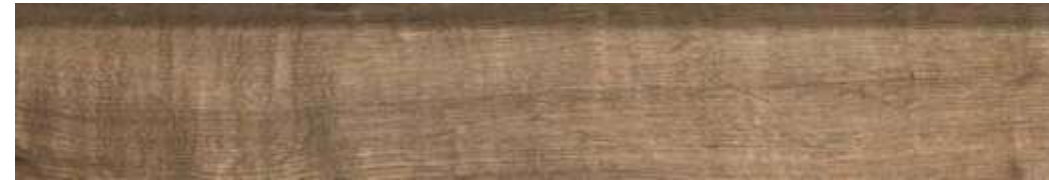
RP Carvalho HD | 20x120 cm | 8x47"