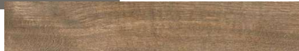
Carvalho HD | 12x120 cm | 8x47"