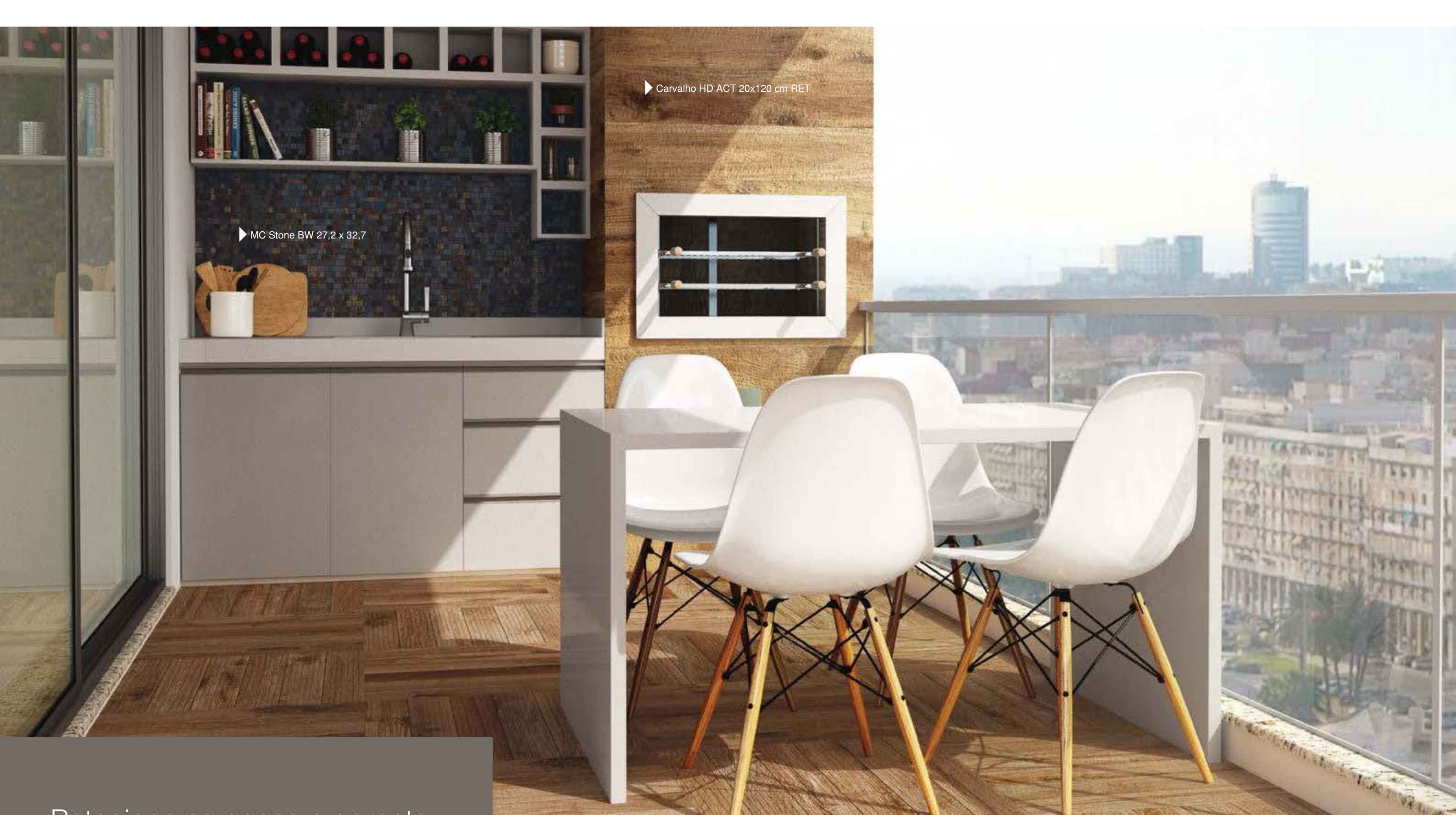
▶ Carvalho HD ACT 20x120 cm RET