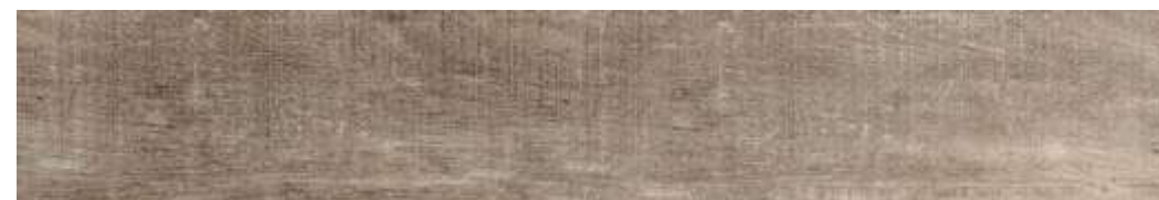
Peroba HD | 20x120 cm | 8x47"