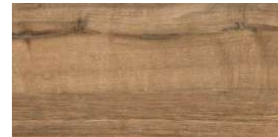
GDN Carvalho HD | 30x60 cm | 12x24"