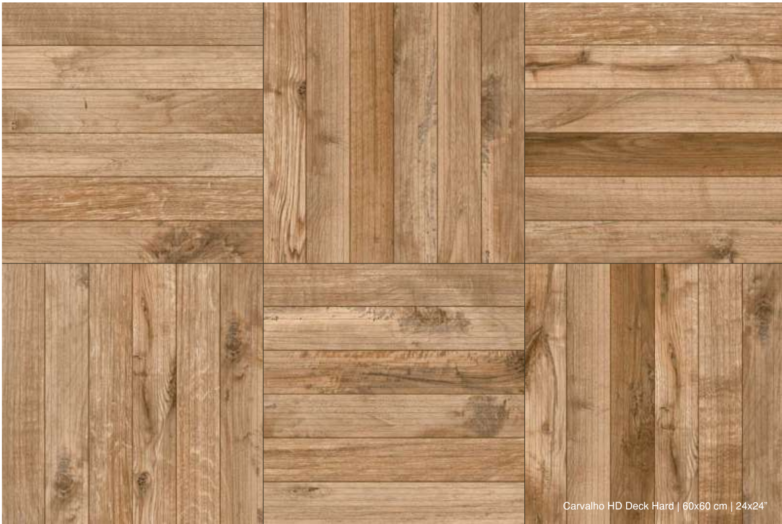
Carvalho HD Deck Hard | 60x60 cm | 24x24"

Acabamento ideal para bordas de piscinas e escadas. The perfect finish to pool decks and stairs. El acabado perfecto para rebordes de piscinas y escaleras.