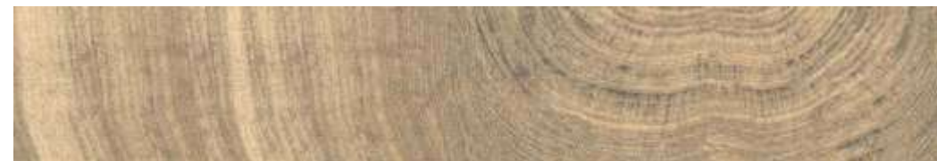
Carvalho Cross HD | 20x120 cm | 8x47"