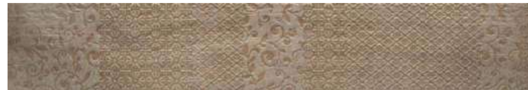
Carvalho HD Decor | 20x120 cm | 8x47"