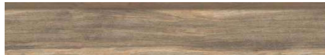
Carvalho Cross HD | 20x120 cm | 8x47"