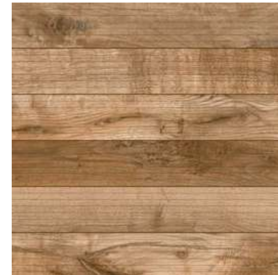
Carvalho HD Deck Hard | 60x60 cm | 24x24"