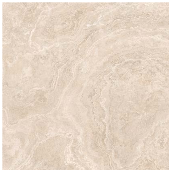
Travertino Cross Cut BE MLX DD ✦

texturas sincronizadas trazendo mais exclusividade