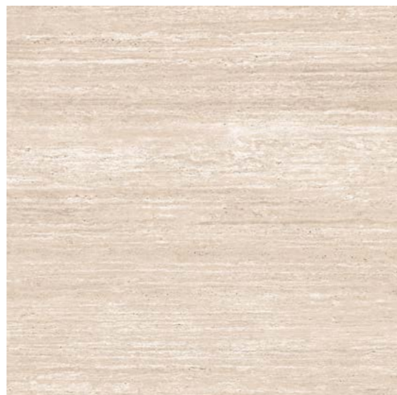
Travertino Vein Cut BE NAT DD ✦

120x120 / 47x47" 1200,0x1200,0x9,0 mm MLX - USO 4 / V3 6062812